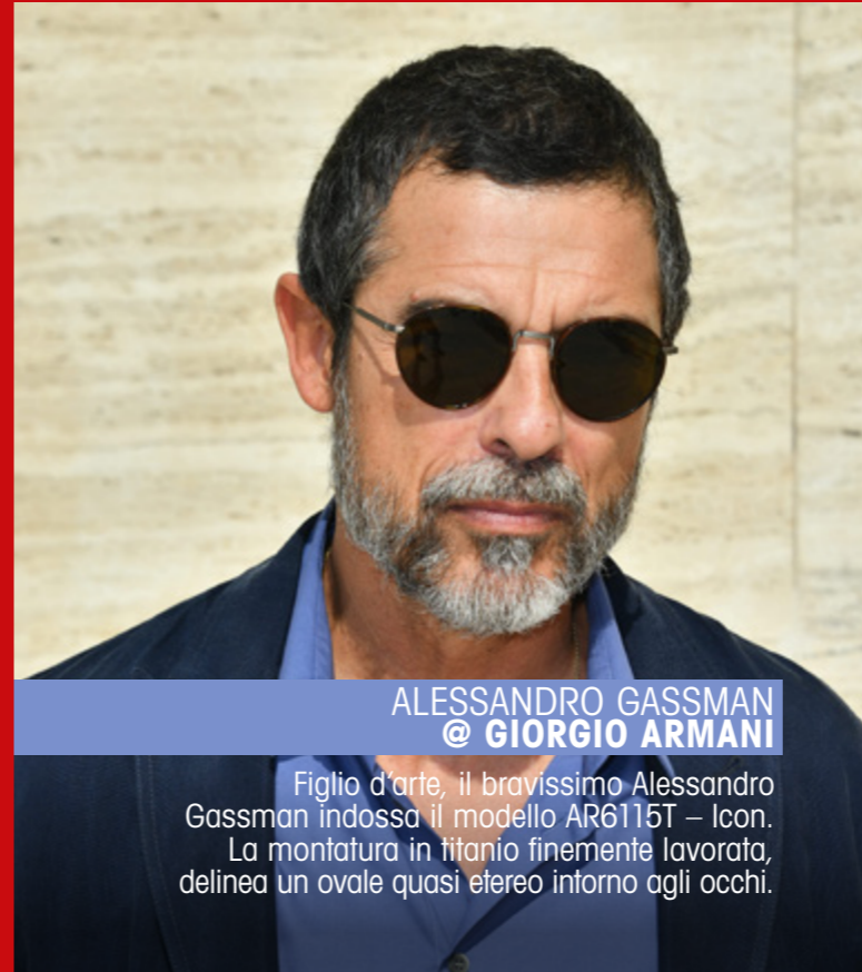
ALESSANDRO GASSMAN @ GIORGIO ARMANI

L'attrice fiorentina ha scelto di indossare una riproduzione autentica dell'originale Ray-Ban Wayfarer RB 2140. Realizzato interamente in acetato stampato a iniezione, è un'icona dal 1952.