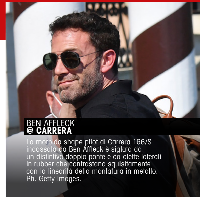
BEN AFFLECK @ CARRERA