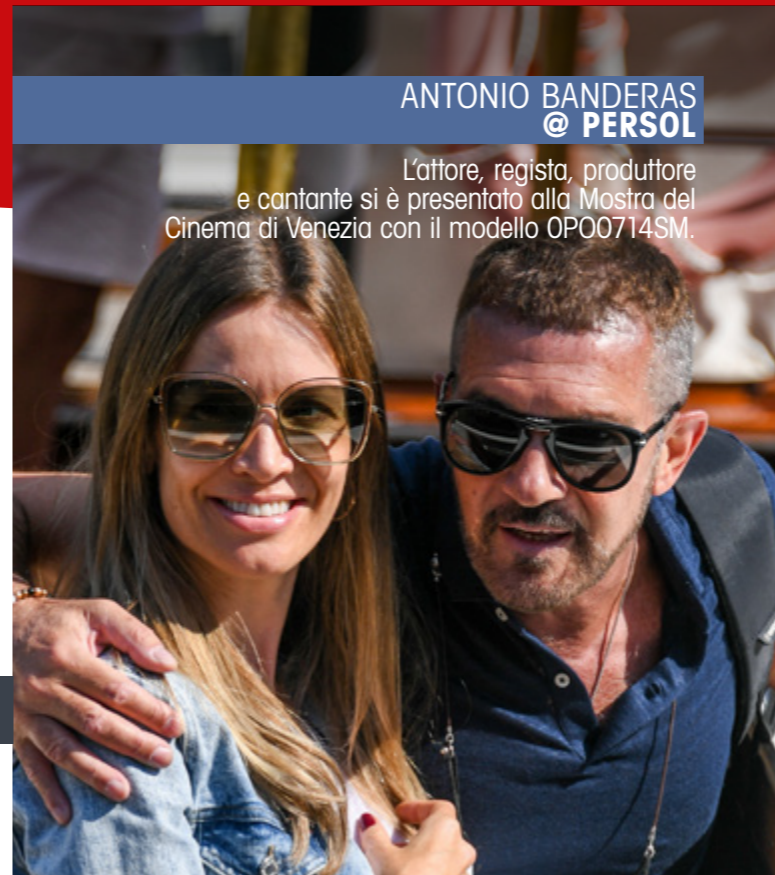
ANTONIO BANDERAS @ PERSOL

Figlio d'arte, il bravissimo Alessandro Gassman indossa il modello AR6115T – Icon. La montatura in titanio finemente lavorata, delinea un ovale quasi etereo intorno agli occhi.