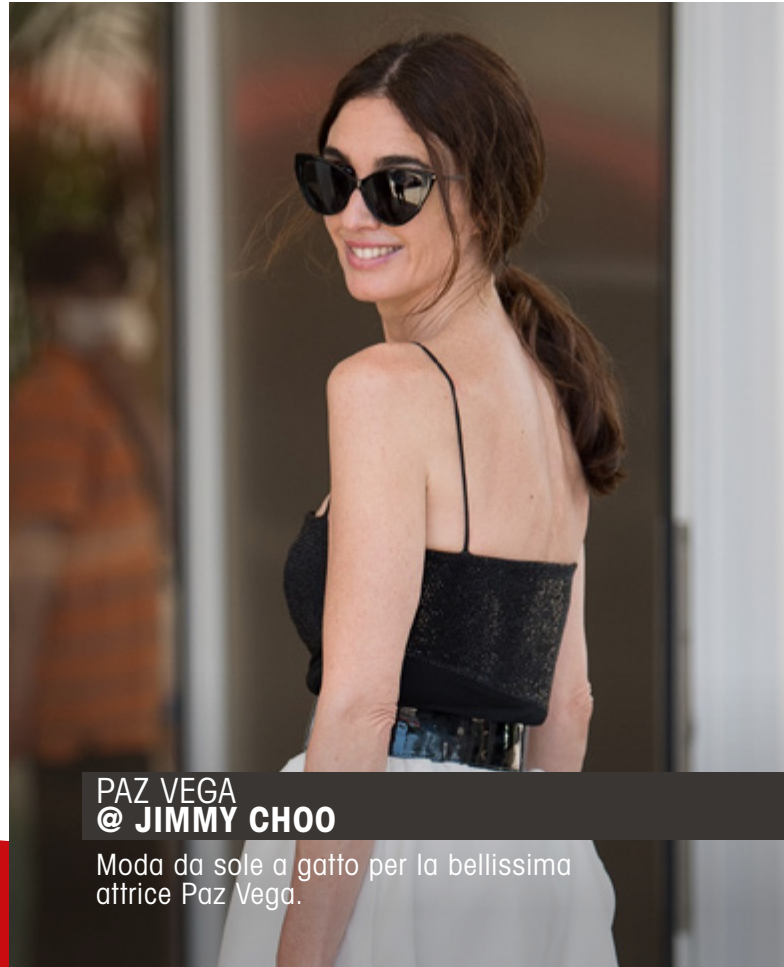
PAZ VEGA @ JIMMY CHOO

L'attrice Maisie Williams della serie televisiva Game of Thrones indossa il modello Alex.