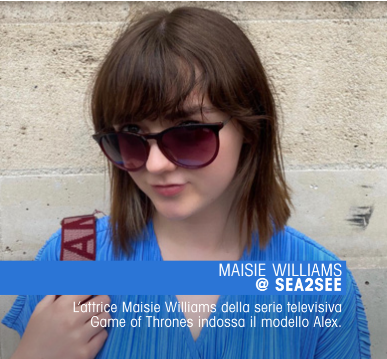
MAISIE WILLIAMS @ SEA2SEE

L'attrice Maisie Williams della serie televisiva Game of Thrones indossa il modello Alex.