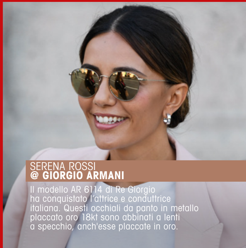
SERENA ROSSI @ GIORGIO ARMANI

Le forme maxi del modello BOSS 1280s incorniciano il viso dell'attrice, cantante, modella e ballerina statunitense Kat Graham.