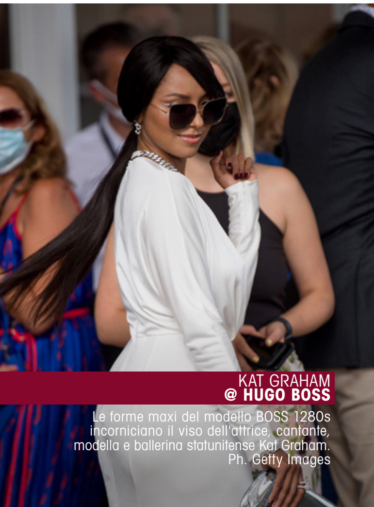
KAT GRAHAM @ HUGO BOSS

Moda da sole a gatto per la bellissima attrice Paz Vega.