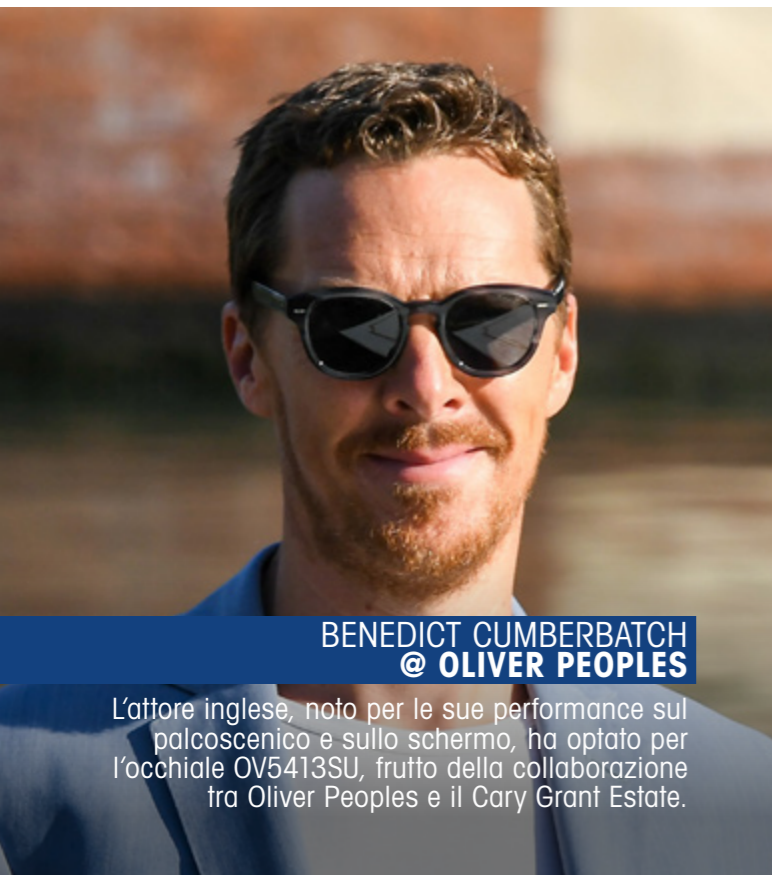
BENEDICT CUMBERBATCH @ OLIVER PEOPLES

L'attore inglese, noto per le sue performance sul palcoscenico e sullo schermo, ha optato per l'occhiale OV5413SU, frutto della collaborazione tra Oliver Peoples e il Cary Grant Estate.